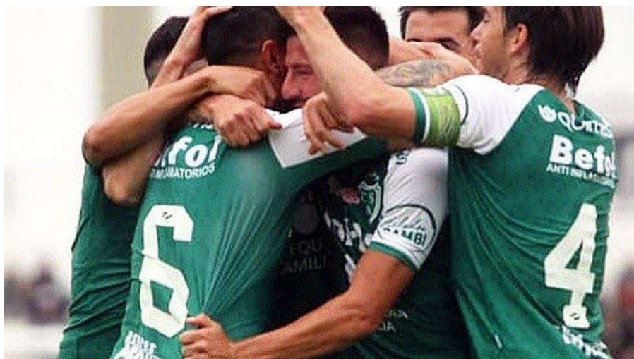
El Verde festeja la punta y espera por Nueva Chicago.