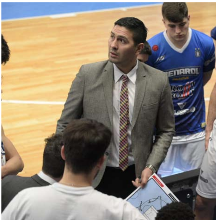
Gutiérrez cree que el formato que propone la LNB le permite a los equipos chicos ser competitivos.