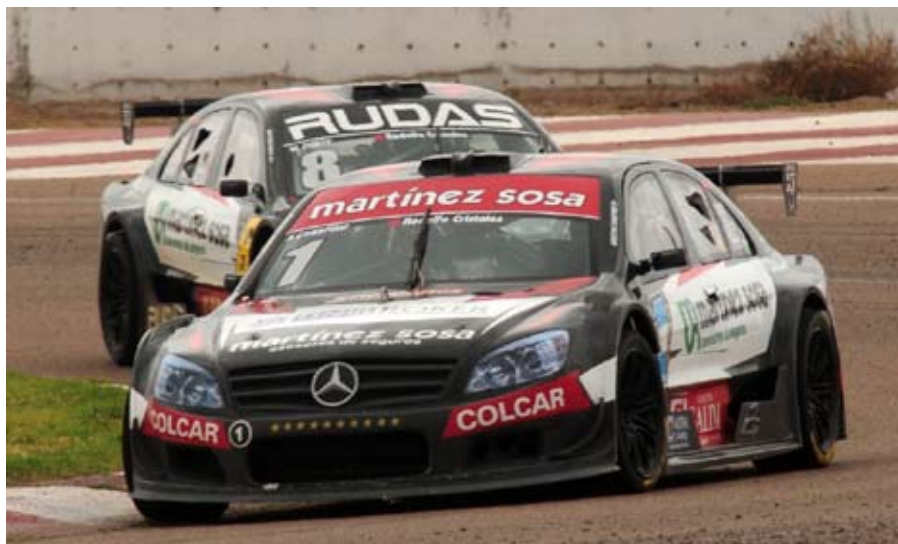
El piloto de Arrecifes lidera las tres categorías más importantes del automovilismo argentino.