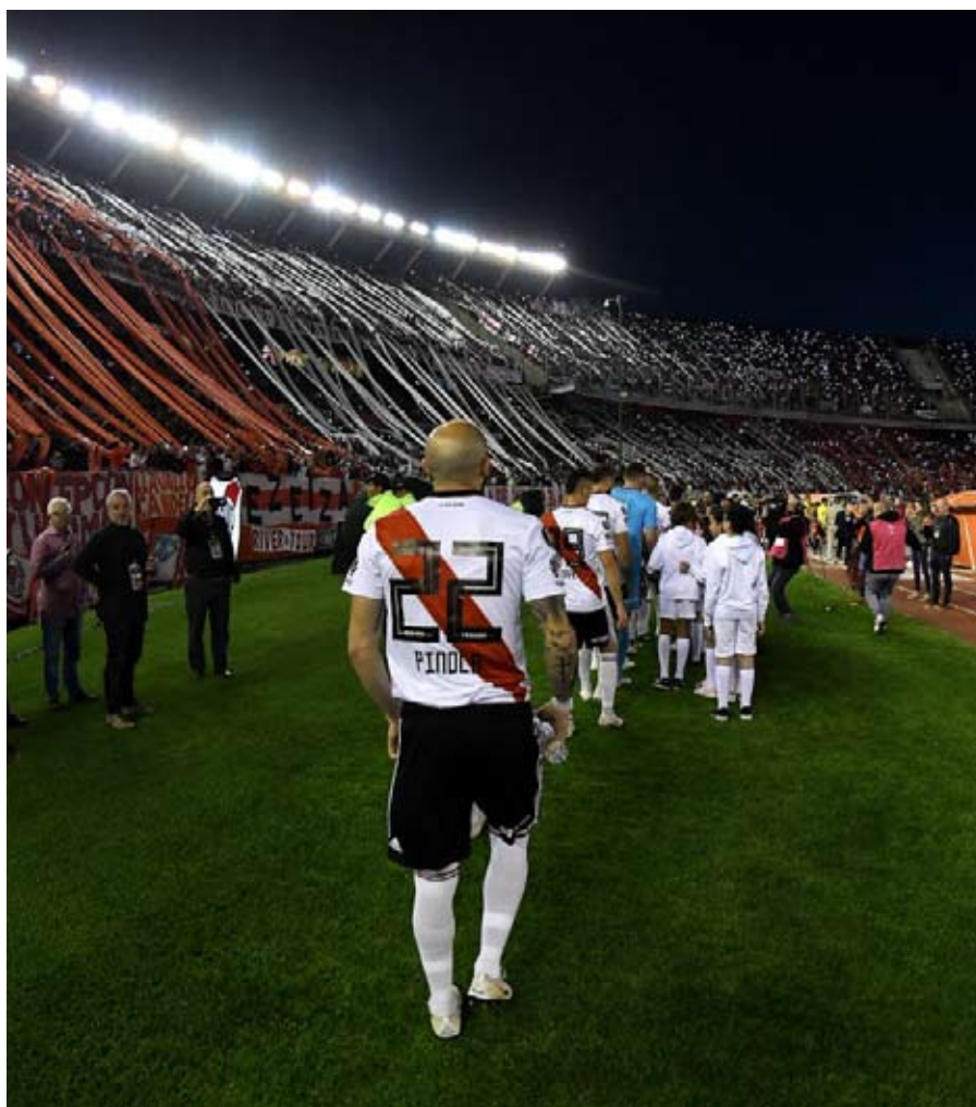
River espera repetir ante Gremio la fiesta que vivió el Monumental en los cuartos frente a Independiente.

a equipos brasileños es negativo: ganó 28 partidos, empató 17 y perdió 35. Y también está en desventaja por la Copa Libertadores: ganó nueve, empató cuatro y perdió 14.