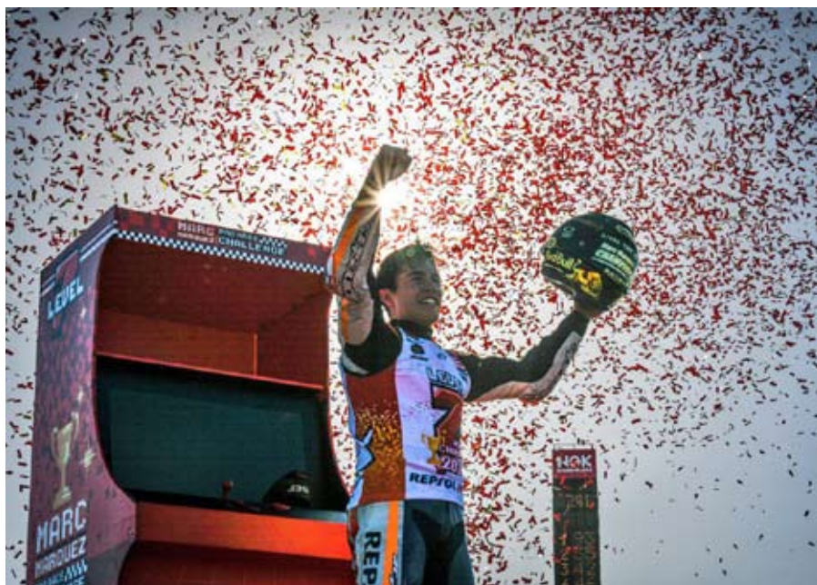
El piloto de Honda consiguió su quinta corona en la máxima categoría del motociclismo.