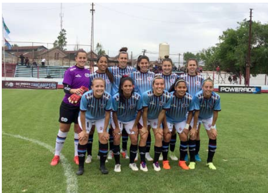
El equipo, puntero, sonríe antes y después de los partidos.