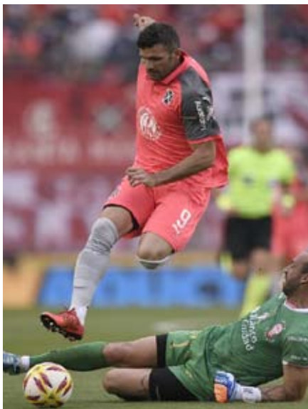
Un Puma que vale 20 palos verdes

Acerca del encuentro ante Huracán, Gigliotti opinó que fue un muy buen partido pero tal vez no el mejor y que el equipo no