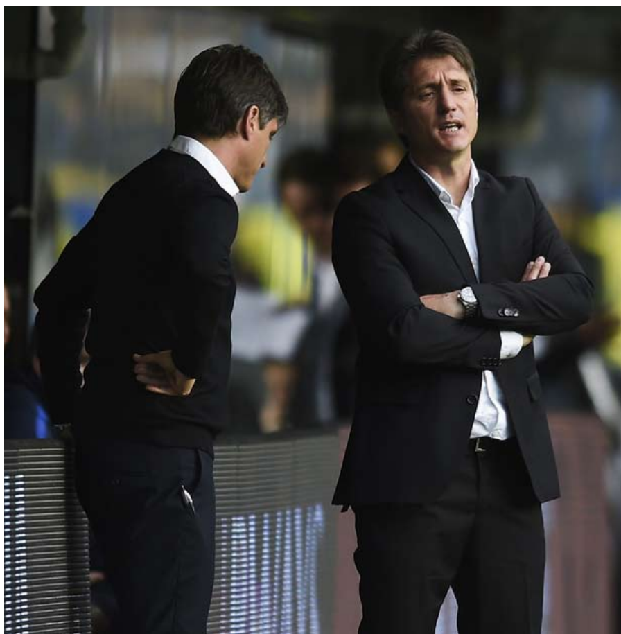
Las dudas de Guillermo y Gustavo: tienen un muy buen plantel pero con bajos rendimientos.

El fútbol y sus paradojas depositan nuevamente una situación decisiva entre Boca y Palmeiras en la misma edición de la Copa Libertadores: el Albiverde le dio vida en fase de grupos para avanzar a los play offs, dado que, en la última fecha, superó a Junior de Barranquilla, el rival que peleaba la clasificación con el Xeneize. Ahora, los de Guillermo podrían costarle el pase a la