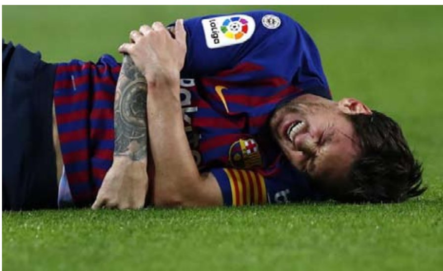
Preocupación en Cataluña por la lesión de Messi.