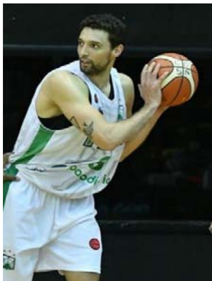
El alero es una de las figuras del equipo.

El alero, que aportó nueve puntos y bajó diez rebotes, aseguró que la imagen que buscarán mostrar en los próximos encuentros será la del segundo tiempo ante Boca, en el que exhibieron su mejor faceta defensiva. Además, en materia de ataque el jugador afirmó que buscarán afianzar la confianza de los extranjeros que integran