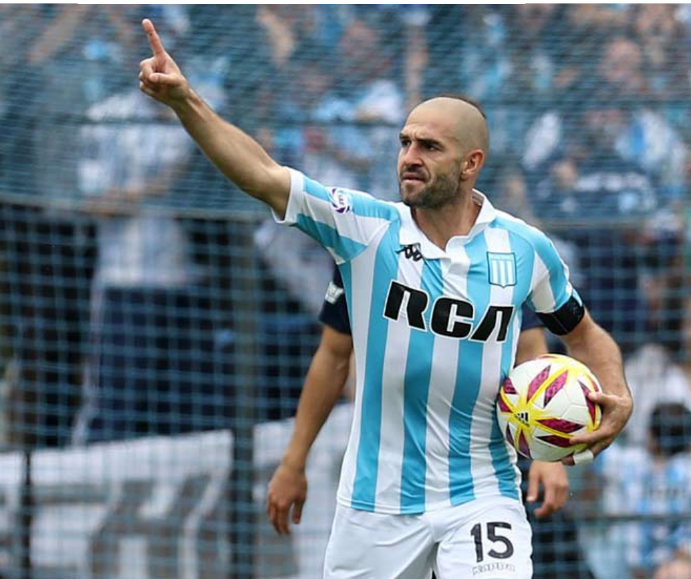
La ceremonia del festejo del primer gol de Racing. López dio otra muestra de su clase.