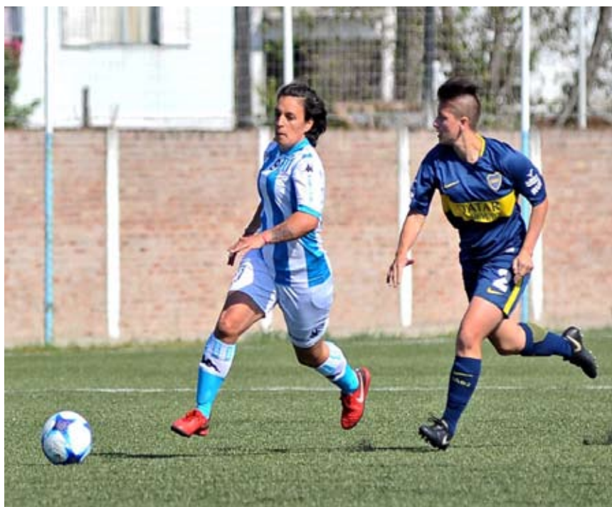
Las Gladiadoras lograron un histórico triunfo ante Boca.