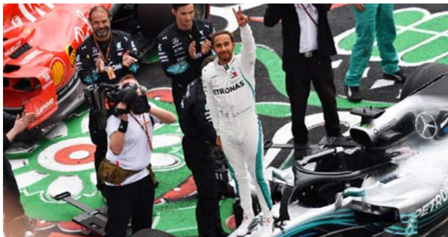
“El circo de la Formula 1 celebra su nuevo campeón”.