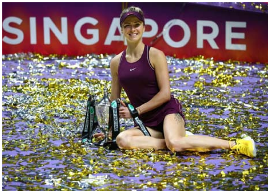
Elina Svitolina, que nunca ganó un Grand Slam, se quedó con el torneo que reúne a las 8 mejores.