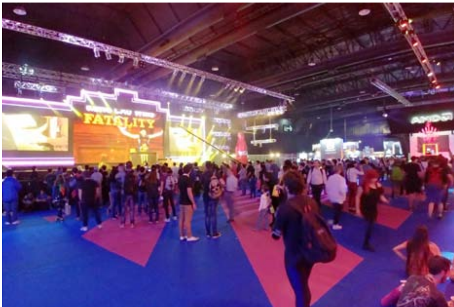
Como en Las Vegas, pero acá. Así lució la tercera edición del Argentina Game Show For me.