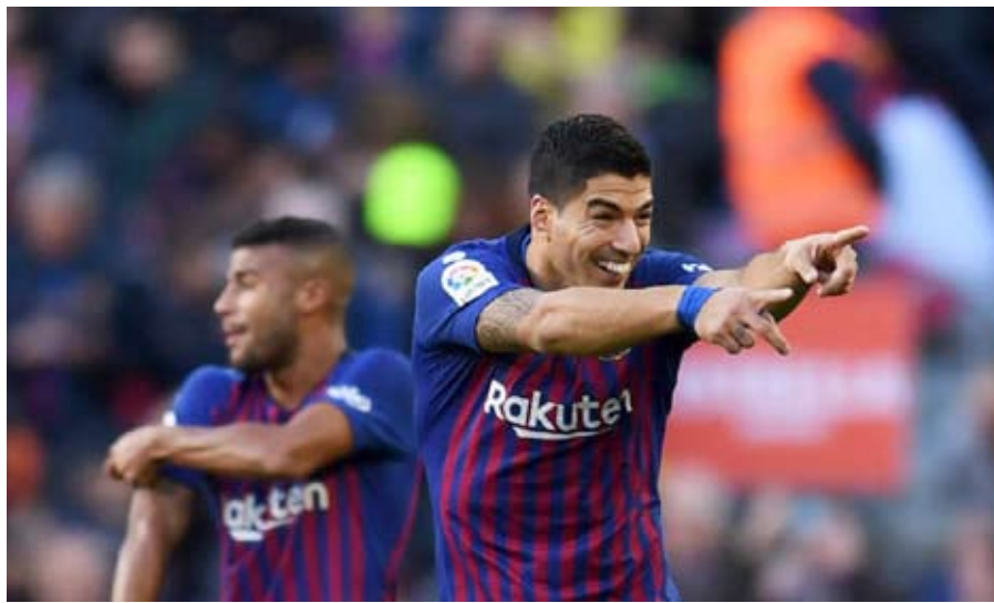
Suárez festaja, metió tres e hizo sonreír al Barcelona a pesar de la ausencia de Messi.